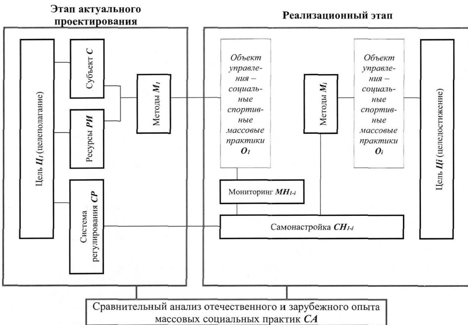
Рис. 2. Модель повышения результативности управления массовыми спортивными практиками на основе использования зарубежного опыта

Обоснование социопроектных предложений по повышению социальной результативности регионального управления массовыми спортивными практиками произведено в форме системной модели, включающей взаимосвязанные целеполагающие, субъектные, инфраструктурно-ресурсные, организационно-технологические и регулирующие компоненты.